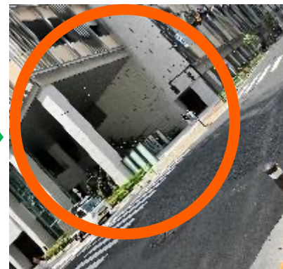
④対角が「八重洲セントラルタワー」到着