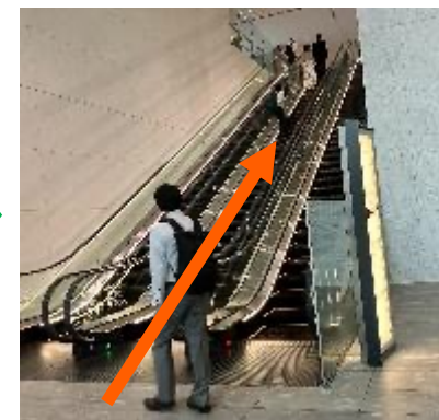
④2Fオフィスロビーに到着