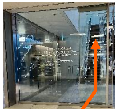
②目的地到着正面エスカレーターを上る