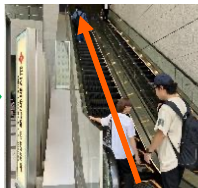
⑤ビル右にあるエスカレーターで上へ