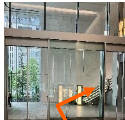
③エスカレーターを上がる