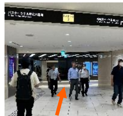
①東京駅地下2番出口の方向に進み看板が出てきたら真っ直ぐ進む