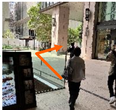
②エスカレーターを上り右へ曲がる