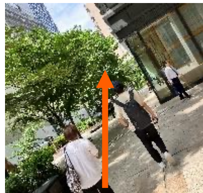
③交差点に向かい真っ直ぐ進む