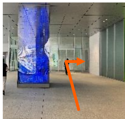
⑥自動ドアを通り、右へ曲がる