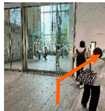
③さらにエスカレーターを上り、2Fオフィスロビーに到着