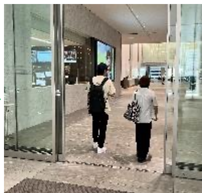
⑦ 2Fオフィスロビーに到着