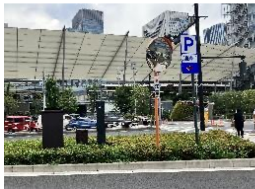
①東京駅八重洲中央口を出て横断歩道を渡る