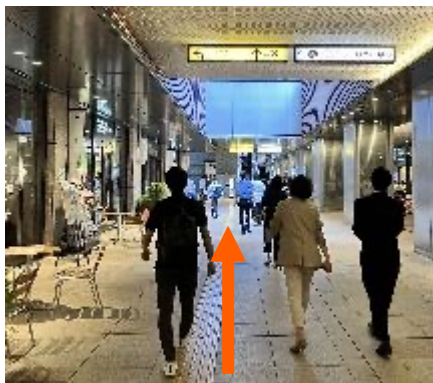
①京橋駅8番出口を出て、正面のエスカレーターを上る