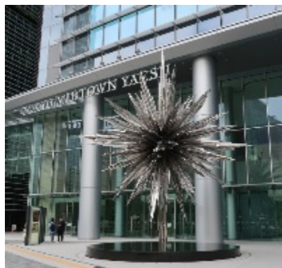
②横断歩道を渡って右側の建物が目的地。正面の自動ドアを通る